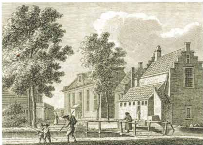
De rooms-katholieke schuilkerk in Maarssen, 1788. Gravure door K.F. Bendorp naar een tekening van J. Bulthuis.

Verder besloot de overheid dat religieuze gebouwen en delen van het bezit verdeeld moesten worden naar rato van hun lokale 'aanhang'. Dit zorgde ervoor dat op verschillende plaatsen de rooms-katholieken aanspraak konden maken op 'hun' oude kerkgebouw, dat met de Reformatie in handen van de protestanten was overgegaan. Dat kon tot gevolg hebben dat hervormde gemeenschappen claims tot genoegdoening konden verwachten van rooms-katholieke plaatsgenoten, al werd de soep in de praktijk over het algemeen niet zo heet gegeten. In de hervormde gemeente Blauwkapel-Groenekan kwam die ontwikkeling in de kerkenraadsvergadering van juni 1798 ter sprake. Men had een brief ontvangen van de classis (kerkregio) met het verzoek om informatie over de diaconiegoederen en het bezit, om in geval van katholieke claims de lokale gemeente bij te kunnen staan: 'om haar raad en hulpe [te bieden] ingevalle de Roomsgezinden volgens de Staats-