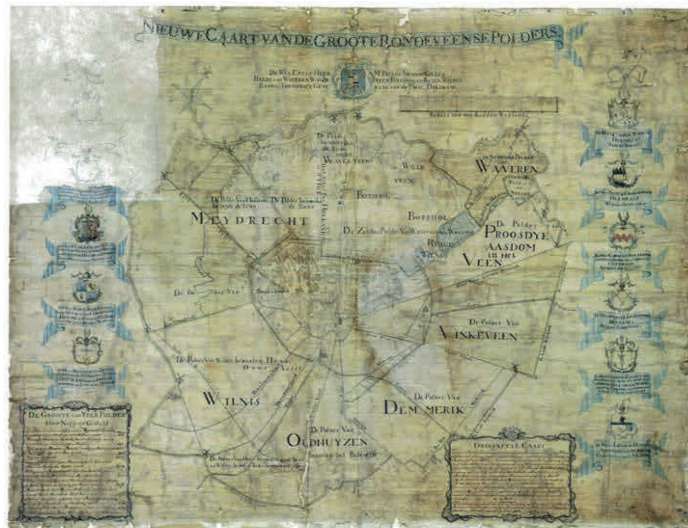
Kaart van de Grootte Rondeveense Polders door Gerbrand Praalder, 1782. Collectie: RHCVV.

Al snel na de Bataafse Omwenteling van 1795 werd de Nationale Vergadering ingesteld als eerste moderne parlement van Nederland. De afgevaardigden spraken over de vorm en inrichting die de nieuwe staat moest krijgen. Belangrijk onderdeel daarin was het ontwerpen van een grondwet, maar over de inhoud daarvan kon men het niet eens worden. Er moest uiteindelijk een staatsgreep aan te pas komen om tot de Staatsregeling te komen die in mei 1798 in werking trad. Deze eerste grondwet voerde tal van revolutionaire idealen door. Ons land werd een eenheidsstaat. Er kwam een trias politica: een scheiding der machten in een wetgevende, uitvoerende en rechtsprekende macht, die elkaar in evenwicht moesten houden. De scheiding tussen kerk en staat werd vastgelegd